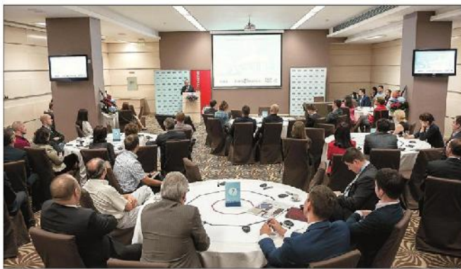
Conferința comunității de afaceri din Cluj, organizată de BCR și Ziarul Financiar. În stânga: o sală de conferințe și dezbateri a summitului județean

Clujul este un model pentru România, iar acest model trebuie dus către toate zonele din țară. Principalul actor în dezvoltarea economică a Clujului este universitatea, iar datorită acestui aspect vin investitorii străini aici și serviciile funcționează așa de bine. Viitorul economic al Clujului constă în abilitarea numărului de studenți odată cu crearea unor centre de practică, astfel ca municipiul Cluj-Napoca să devină capitala universitară a Europei de Sud-Est, a fost concluzia comunității de business din Cluj.